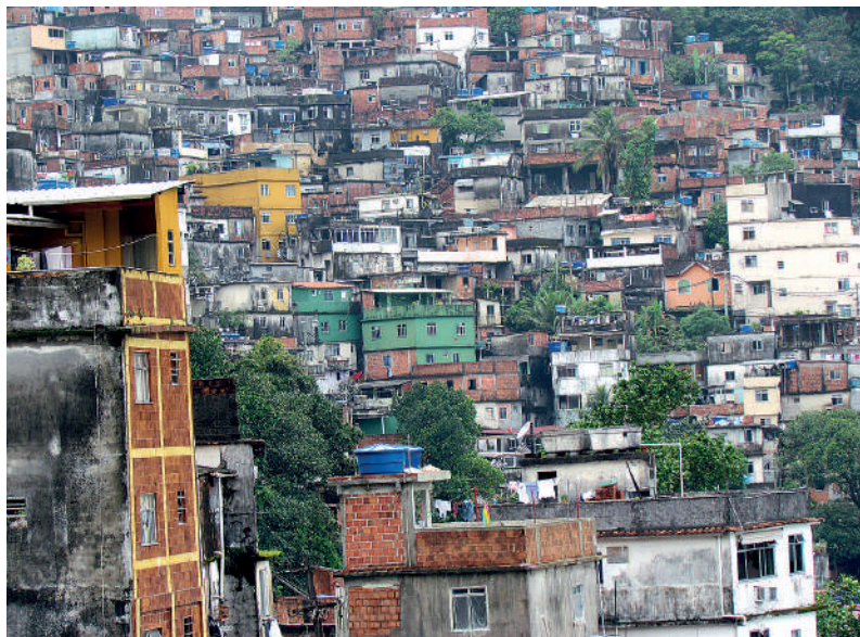
Favela Riocinha na zboczach Rio de Janeiro