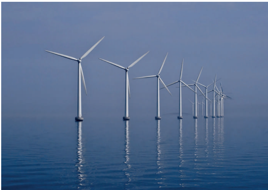
Farma wiatrowa w Danii